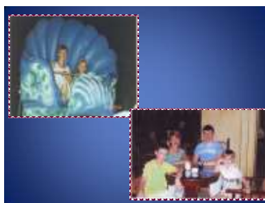
Слайд с презентацией ко Дню рождения

Учащиеся обоих классов очень востребованы в различных мероприятиях, проводимых в школе, принимают участие в большинстве конкурсов и спортивных соревнований.